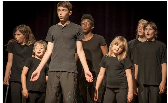
Bilder aus „Der Mensch“